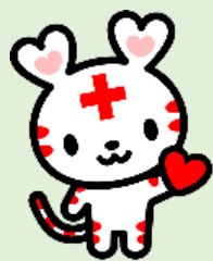
日本赤十字社マスコット キャラクター ハートラちゃん