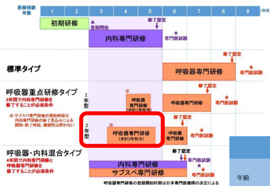
内科専攻医からの呼吸器専門研修の概念図

入院診療 (受け持ち) : 8~10 名前後 指導医—専攻医 (後期研修医) —初期研修医の屋根瓦式チームで診療し、 毎週のカンファレンスで治療方針を検討します 呼吸器内科全体の入院患者数は平均 30 名前後です