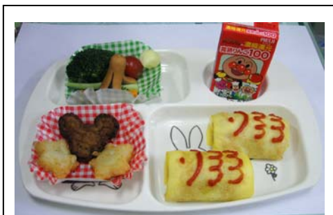
こどもの日・こいのぼりオムライス