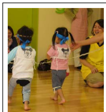
運動会・ヨーイドン！