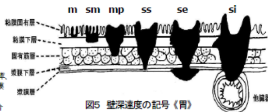
図5 壁深さの記号《胃》