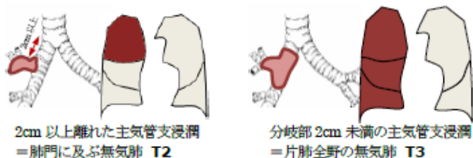
図7 主気管支浸潤のパターン