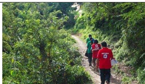
赤十字ボランティア・職員と共に保健教育のため山道を歩いて行く様子