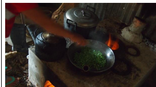
電気、ガスがないため竈（かまど）で煮炊きする様子 ※水は、ため水をやかんで沸かして飲用とする（現地の住民は生水を飲むことも多く、下痢の原因の一つ）