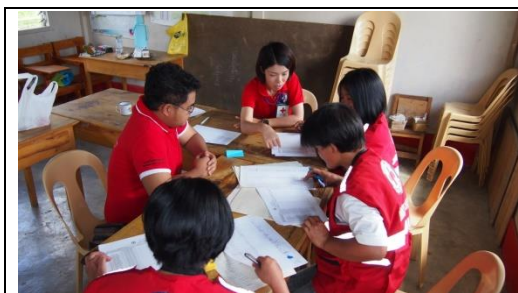
赤十字ボランティアとのミーティングの様子

また赤十字の活動は、多くの支援者の協力があってこそ成り立つものだという事も同時に実感しています。多くの方々の支えを十分に活かし、地域に貢献していけるよう引き続き頑張ってまいります。