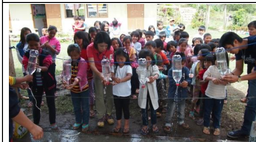
水道がない地域で小学生と手洗い練習をする場面